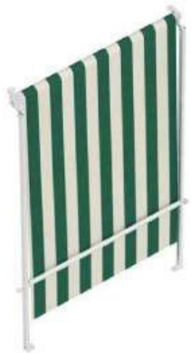
a Caduta con guide